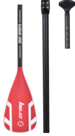
Pagaia Elite in alluminio