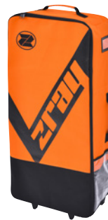
Borsa premium per il trasporto