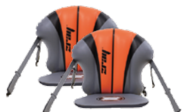
Sièges Kayak gonflables x2