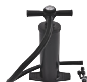
Pompe double flux