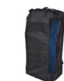
Sac de transport