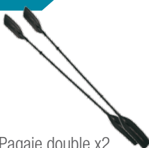
Pagaie double x2