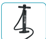
Bomba de alta presión