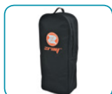
Bolsa de transporte