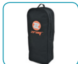
Bolsa de transporte