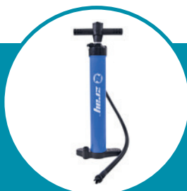
Pompe Haute Pression