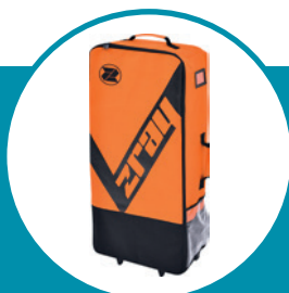
Sac de transport