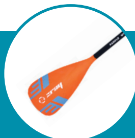
Pagaie 3 sections 170 - 210cm