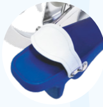
Barfuß-Pedale genehmigter Widerstand