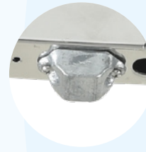
Opferanode für den marinen Gebrauch