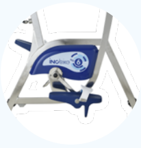
Extrem stabiler X-Struktur

Das Hydrauliksystem mit 6 festen Blättern, die auf der Pedalachse angebracht sind , bietet einen intensiven Tretwiderstand, der den Muskelaufbau und die Herz-Kreislauf-Stärkung fördert . Die Anstrengung wird einfach über die Tretfrequenz gesteigert wodurch sie sich augenblicklich an jede Art von Muskeltraining anpasst. Einfach zu bedienen und sehr effektiv, werden Sie auch sein Design zu schätzen wissen.