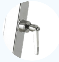
Schnelle Einstellung Click & Turn